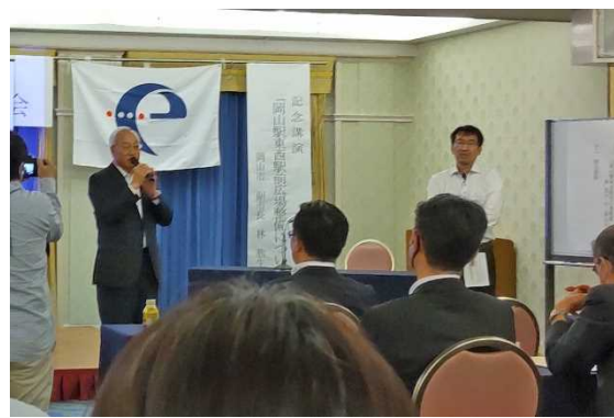
川井新支部長 閉会の挨拶